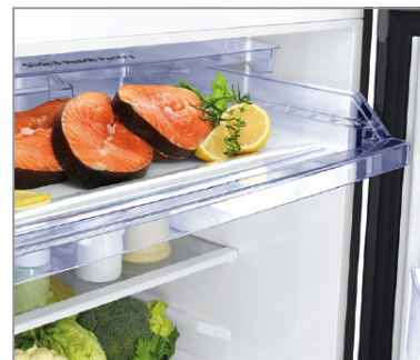
Tiroir Slide & Reach Pantry